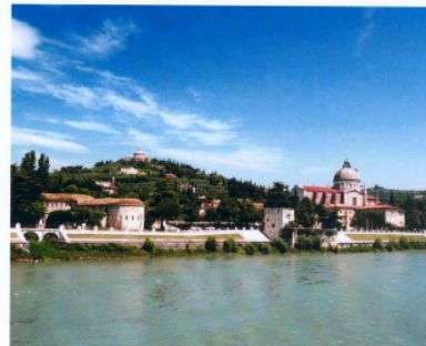
Facharbeit 2010 im Leistungskurs Italienisch

Verona – una prospettiva promettente per una studentessa di Monaco